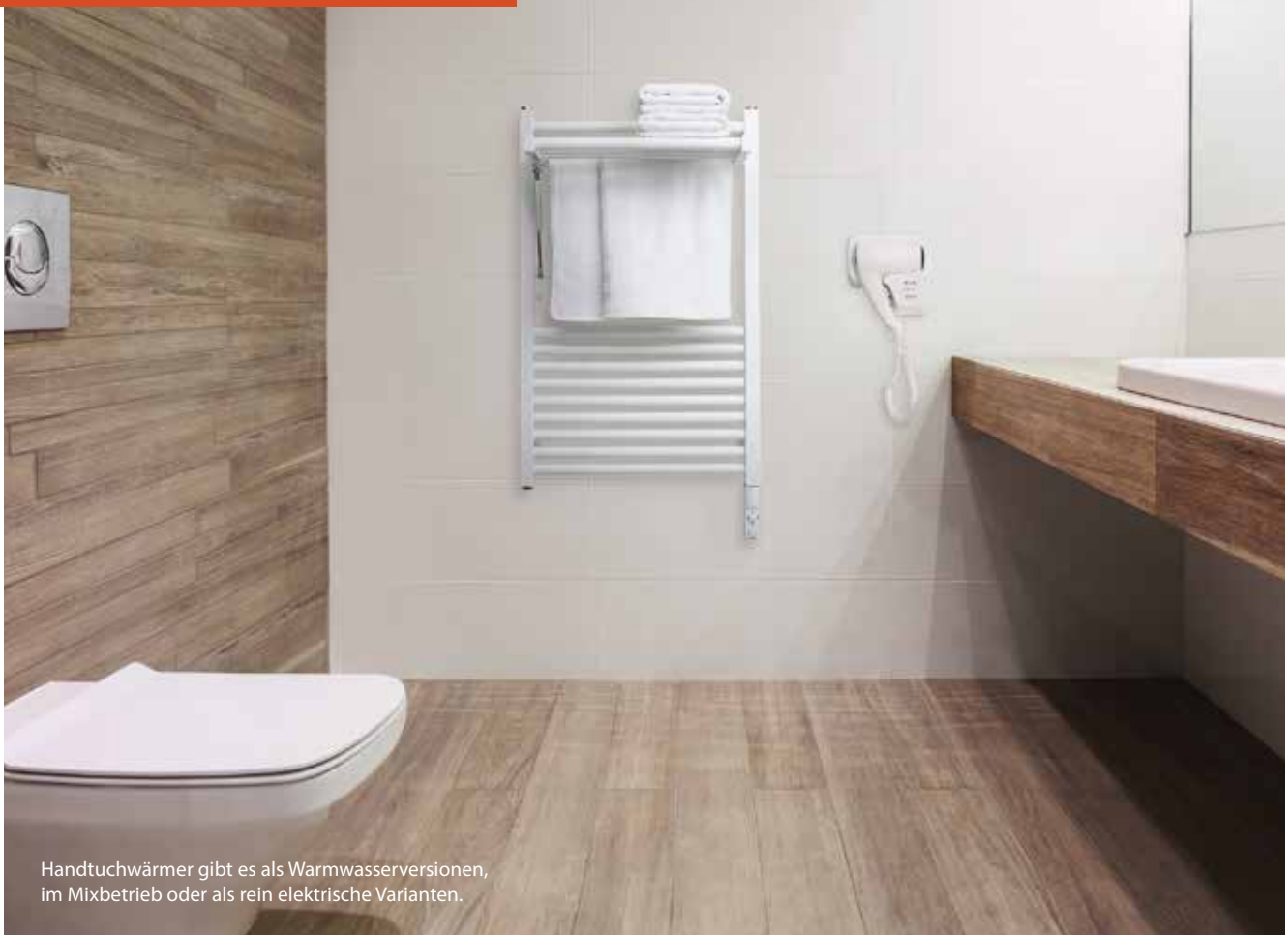
Handtuchwärmer gibt es als Warmwasserversionen, im Mixbetrieb oder als rein elektrische Varianten.